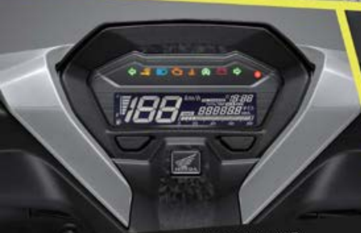
Full Digital Panel Meter