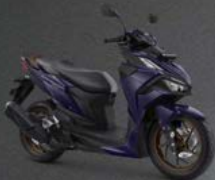
ULTIMATE GLOSSY PURPLE