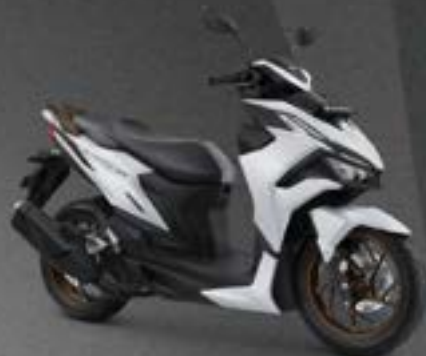
ULTIMATE MATTE WHITE