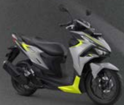
NITRO GLOSSY GREY LIME