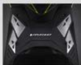
Panel Step Floor