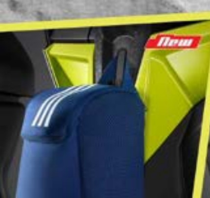
Pop-up Center Hook