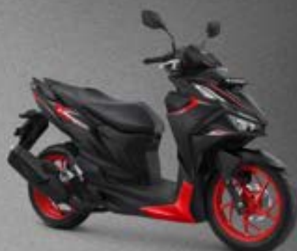
NITRO MATTE BLACK RED