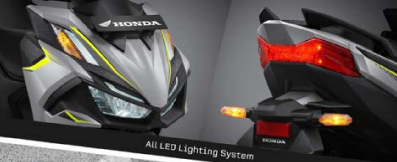
All LED Lighting System