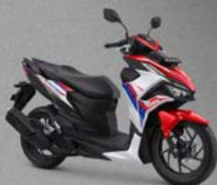
GLOSSY WHITE RED