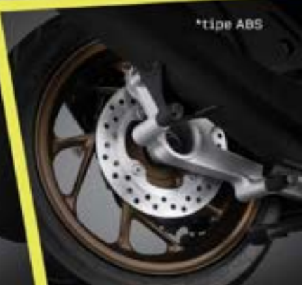
Rear Disc Brake*