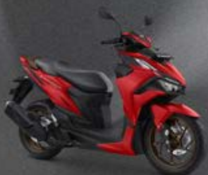
ULTIMATE MATTE RED