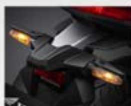
Rear Winker Protector

Tampil lebih sporty dan agresif dengan aksesoris yang menyatu dengan desain New Vario Evo 160 .