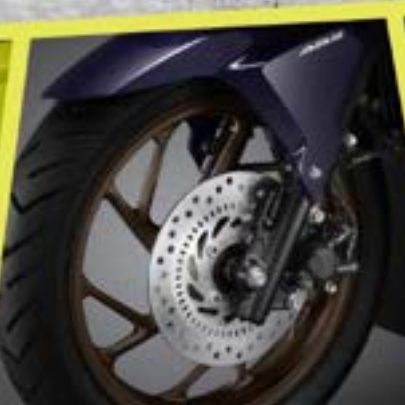
Anti Lock Breaking System*