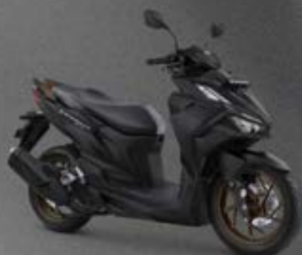
ULTIMATE MATTE BLACK