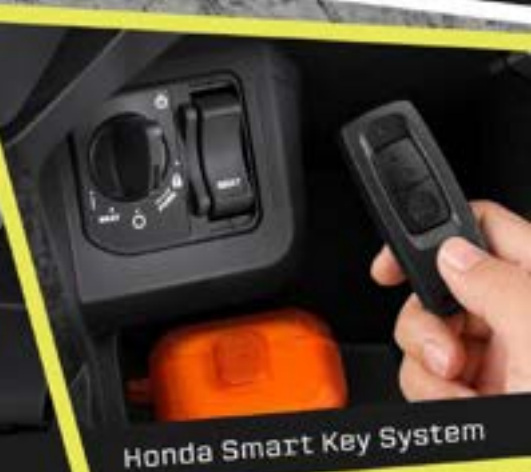
Honda Smart Key System