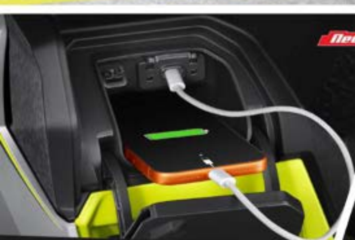
USB Charger Type-C in Console Box