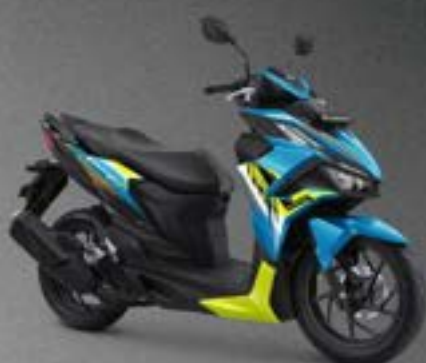
GLOSSY BLUE LIME