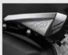
Garnish Air Cleaner