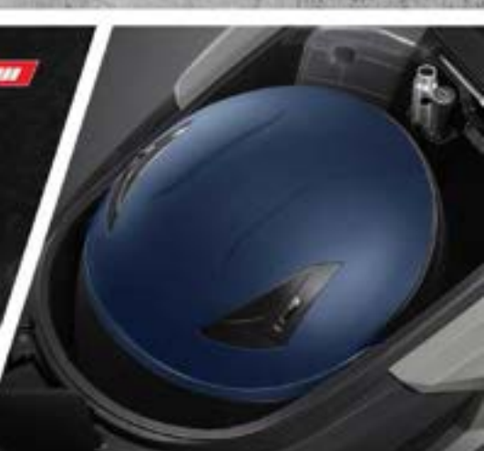
Bagasi Luas 18L Helm In