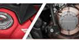
FUEL LID PAD