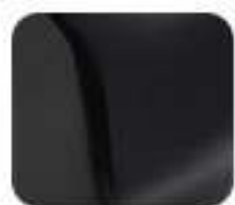
Intelligent Matte Black (EM 1 e:)