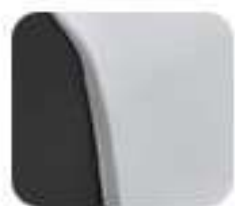
Innovative White (EM 1 e:)