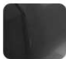
Excellent Matte Silver (EM 1 e: PLUS)