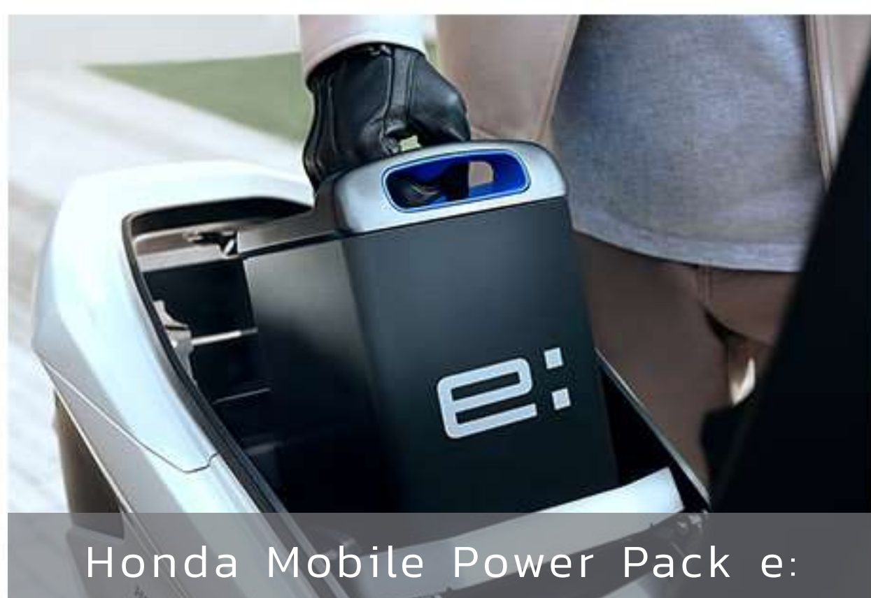
Honda Mobile Power Pack e: