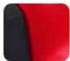
Smart Red (EM 1 e:)