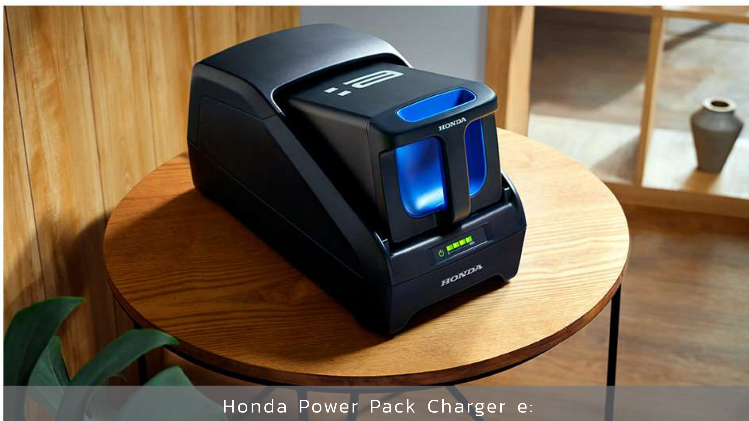
Honda Power Pack Charger e: